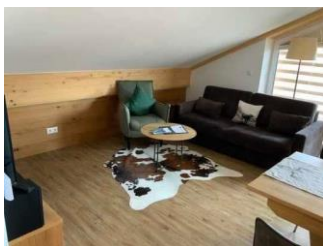
Monusse Boid Wohnung Nr. 18 (DG): Wohnzimmer