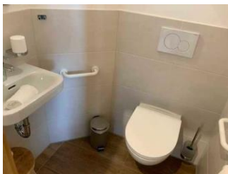
Monusse Boid Wohnung Nr. 18 (DG): Badezimmer