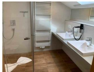
Monusse Boid Wohnung Nr. 18 (DG): Badezimmer