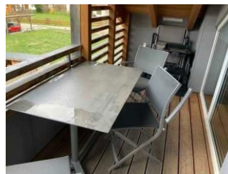
Monusse Boid Wohnung Nr. 18 (DG): Balkon