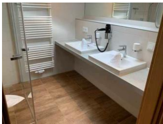
Monusse Boid Wohnung Nr. 18 (DG): Badezimmer