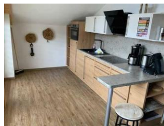
Monusse Boid Wohnung Nr. 18 (DG): Küche