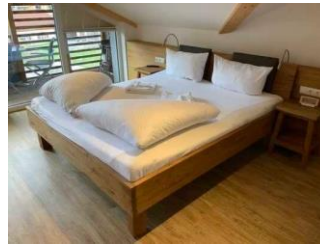
Monusse Boid Wohnung Nr. 18 (DG): Schlafzimmer