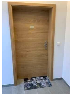
Monusse Boid Wohnung Nr. 12 (DG): Eingangsbereich