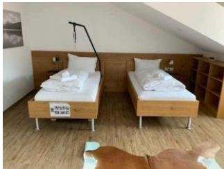
Monusse Boid Wohnung Nr. 12 (DG): Schlafzimmer 1