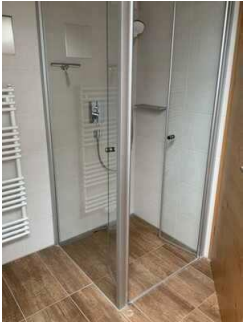
Monusse Boid Wohnung Nr. 12 (DG): Zweites Badezimmer