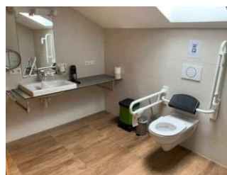
Monusse Boid Wohnung Nr. 12 (DG): Großes Badezimmer