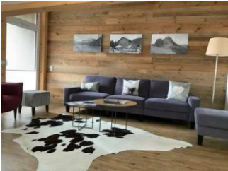
Monusse Boid Wohnung Nr. 12 (DG): Wohnzimmer