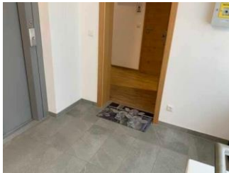
Zugang über den Aufzug zur Wohnung