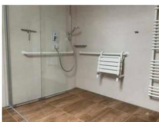
Monusse Boid Wohnung Nr. 12 (DG): Großes Badezimmer