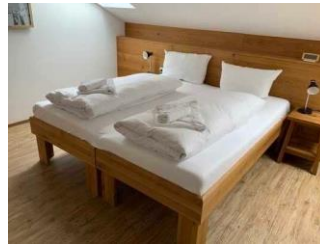
Monusse Boid Wohnung Nr. 12 (DG): Schlafzimmer 2