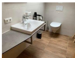
Monusse Boid Wohnung Nr. 12 (DG): Zweites Badezimmer