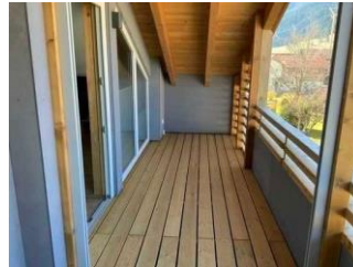
Monusse Boid Wohnung Nr. 12 (DG): Balkon