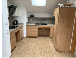
Monusse Boid Wohnung Nr. 12 (DG): Küche