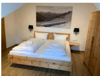
Monusse Boid Wohnung Nr. 12 (DG): Schlafzimmer 3